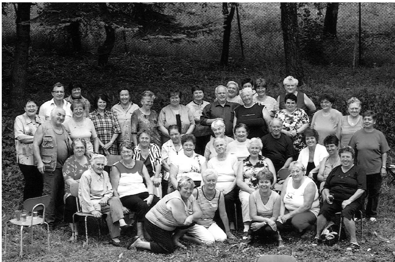
Členovia ZO Jednoty dôchodcov na posedení v prírode