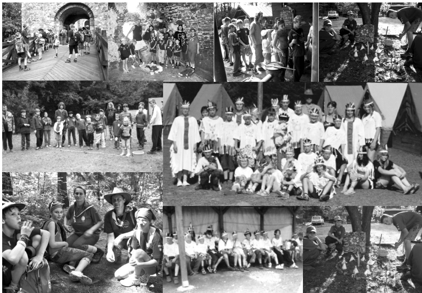
Fotomontáž z činnosti oddielu, viac na www.scarabeus.estranky.sk

Redakcia: OZ Višňové, Počet výtlačkov 700 ks. Zdarma.