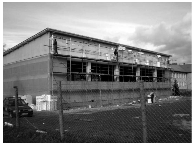
Budova telocvične základnej školy po a pred dokončením